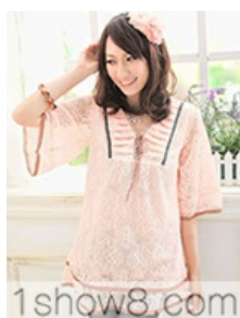
1show8.com B-1291 ĩĩ~ c :÷272C 272 C 6ĭ | -p